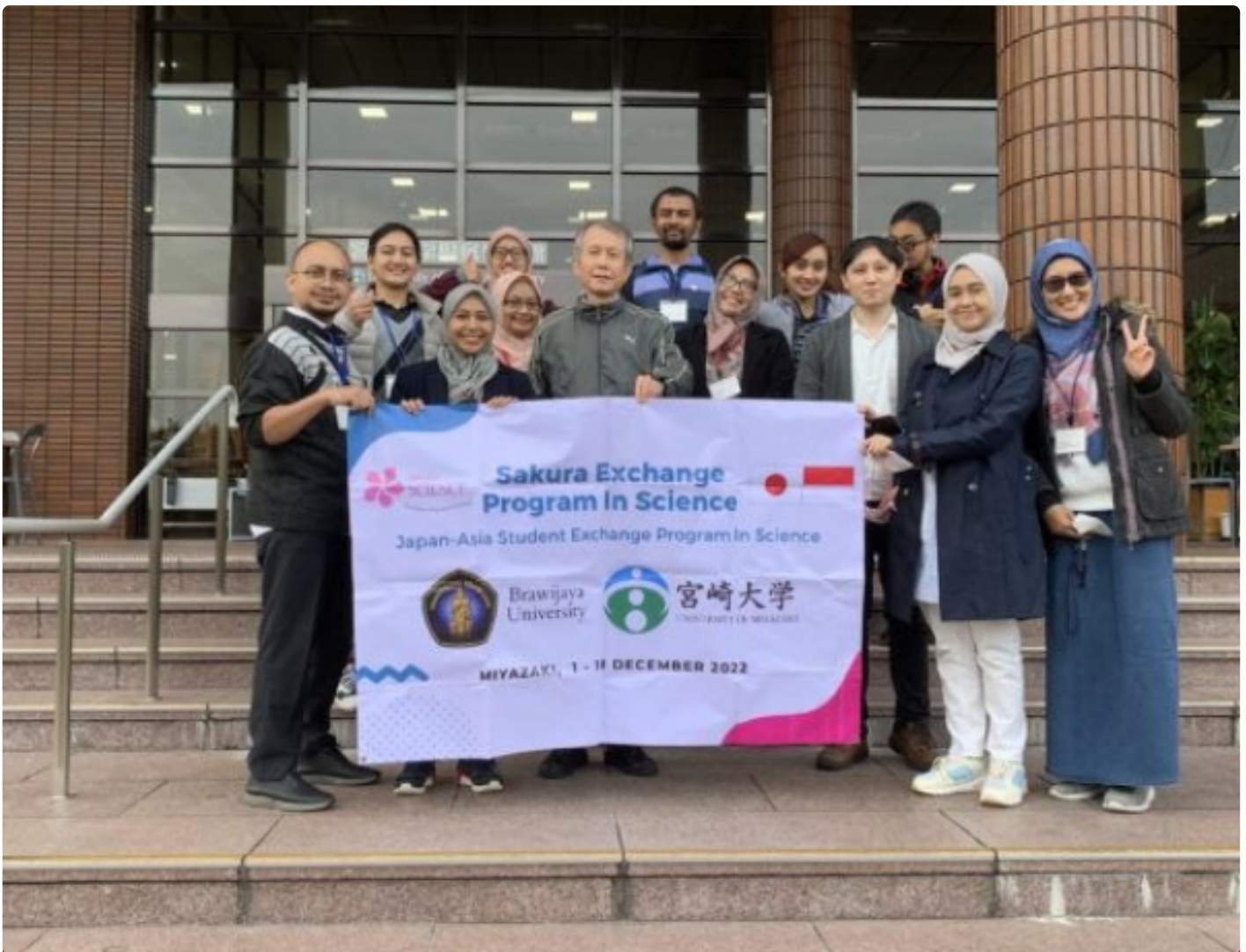
11 Dosen dan mahasiswa FK UB di University of Miyazaki

KOTA MALANG - Kesibukan bukan menjadi penghalang untuk menambah ilmu. Hal ini ditunjukkan oleh 11 orang dari Fakultas Kedokteran, Universitas Brawijaya yang baru saja menyelesaikan Sakura Science Exchange Program di University of Miyazaki, Miyazaki, Jepang.